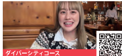
ダイバーシティコース

建築デザイナーとして世界を股にかけて仕事をする、という夢に向けた留学。ロンドン芸術大学で学んだ後、バリ島にある、竹を中心に扱いデザイン性の高さが評価されている建築アトリエでインターンシップを経験した。