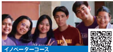
イノベーターコース