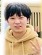
D3年(参加時) ガオソン