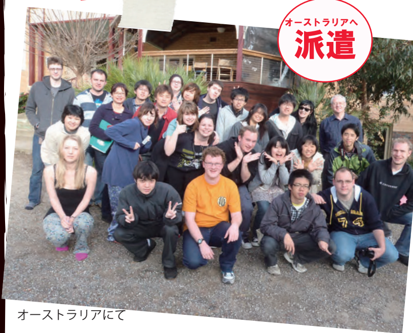
オーストラリアにて

本学と学術交流協定を締結しているオーストラリアのロイヤルメルボルン工科大学(以下RMIT)との短期語学研修プログラムが相互交流として行われました。まずは、平成22年9月8日から24日、本学の学生がオーストラリアで18泊19日の英語研修を行いました。本学からの参加者は学生8名、引率教員1名の合計9名で、今回の研修で1998年の第1期目から12期目となりました。英語研修のメインの部分は、RMITで日本語を学ぶ学生と「ジャパン・クラブ」という日本に関心を持つ学生サークルの学生たちが、英語での交流、メルボルン市内・郊外の見学にチューターとして付き添い、英語でのコミュニケーションの場と機会を提供してくれました。このことが、工大の学生たちに英語でコミュニケーションする動機づけ、必要性、意志の疎通が成功したときの喜びを、強く与えてくれました。