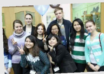
ハバロフスク地区「対外友好協会」の学生たちと