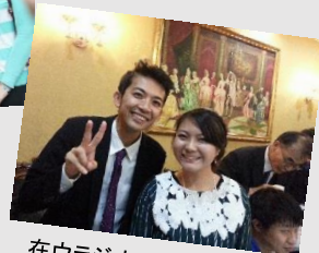
在ウラジオストク日本総領事館で働いている室工大の先輩と