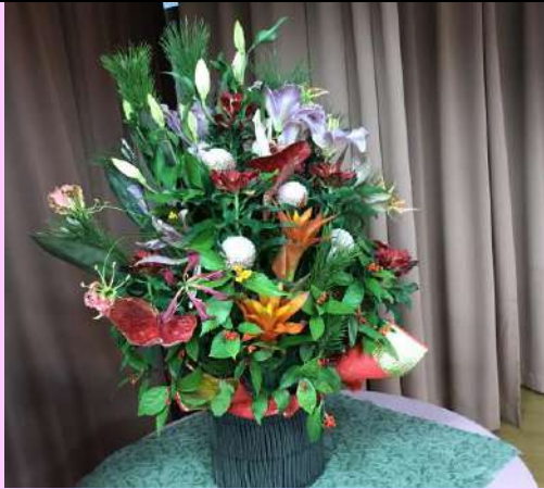
交礼会⑨ 宴会場に置かれた飾り。