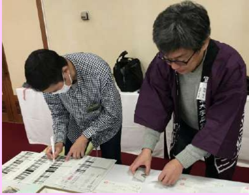
交礼会① きちんと受付しています。