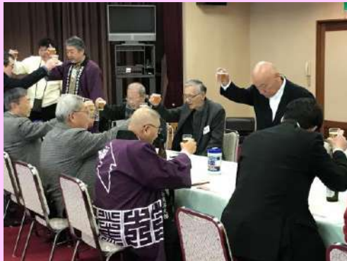
交礼会⑤ みんなで元気に乾杯！