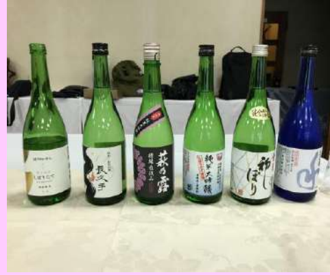
交礼会② 今年もたくさんのお酒をありがとうございます。