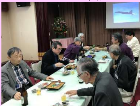
交礼会⑦ みなさまご歓談されています。