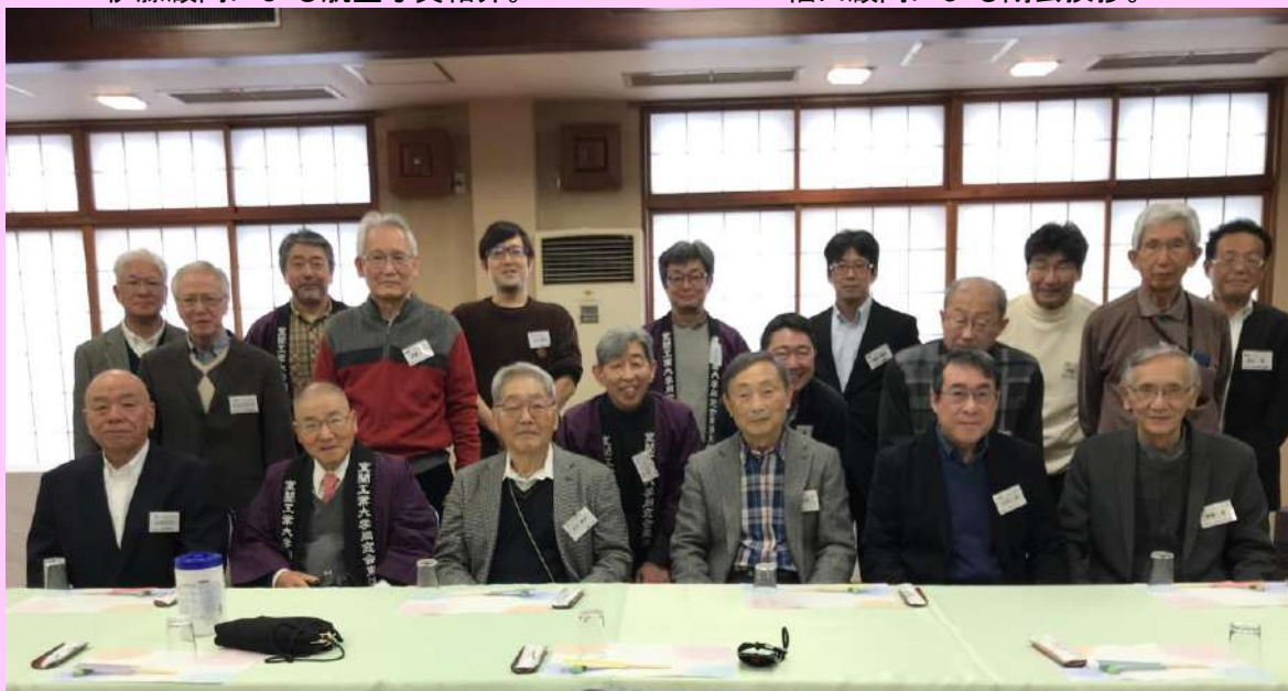
記念撮影 今回は飲む前に撮る！

令和5年度新年交礼会に多くの同窓生の皆様にご参加いただき、誠にありがとうございました。二次会は金山駅で行われました。室工大で学び研究された会員の皆様のご多幸とご健康をお祈り申し上げます。