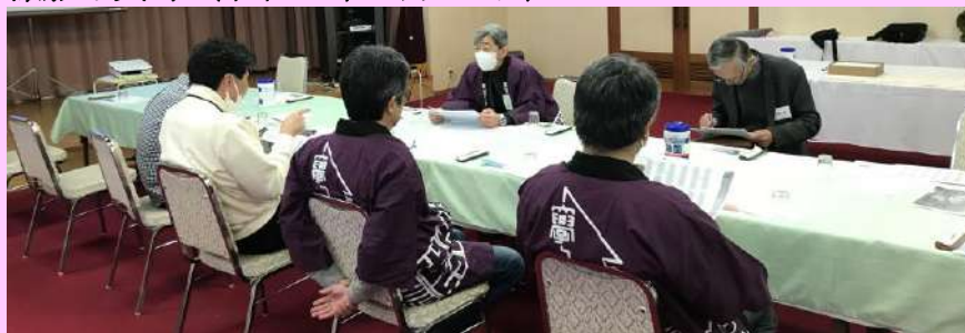
役員会 令和6年度の東海支部行事等の日程について熱心に審議しました。