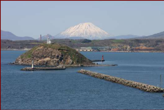
黒百合咲く大黒島