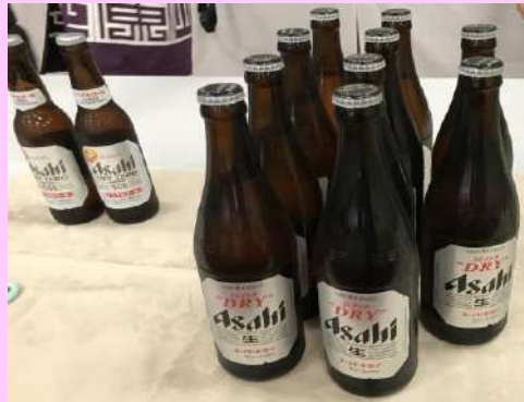
交礼会⑥ 冷えたビールがうまい！