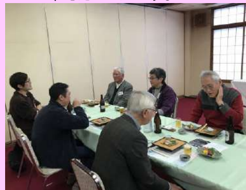
交礼会⑧ みなさまたくさん飲んでいきます。