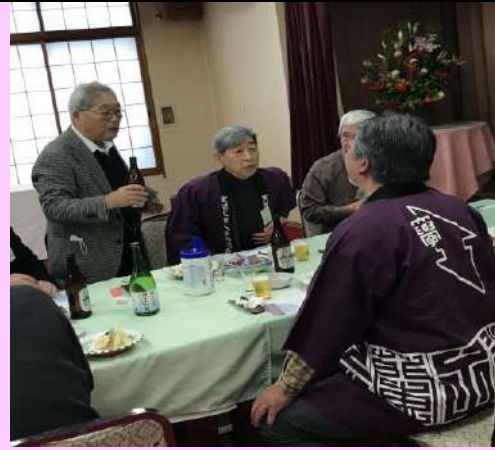
交礼会⑩ たくさん飲もう！