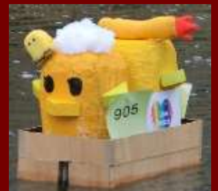
写真 環境浄化のユニークロボット