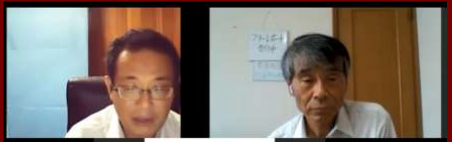
写真 遠隔授業の様子(令和2年7月15日)