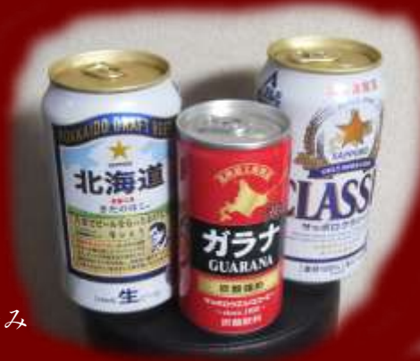
写真 ビールガラナそろい踏み