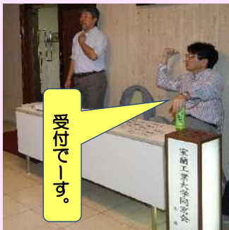
みなさん受付はこちらです！