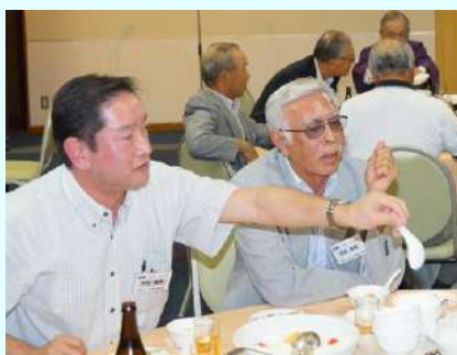
この料理はおいしいね！