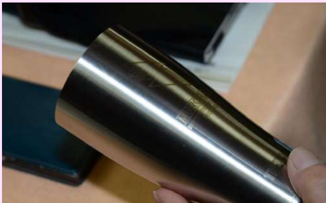
記念品の特製タンブラー