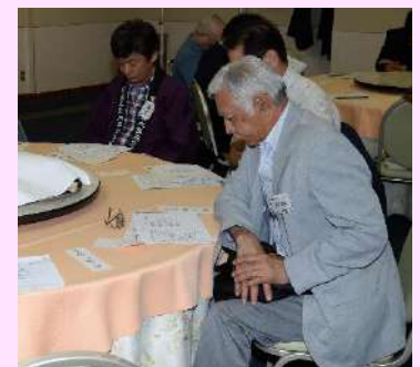
熱心に審議されました。②