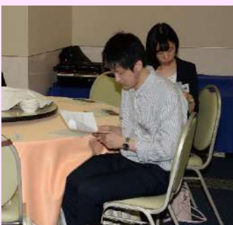
熱心に審議されました。③