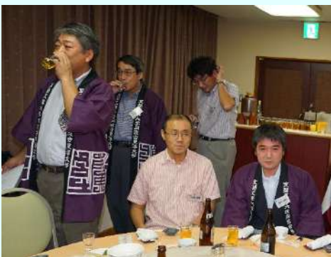
こちらもたくさん飲んでます！