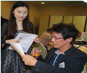
フルート演奏。素晴らしいです！