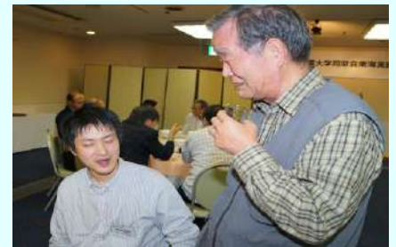
先輩！色々教えてください。