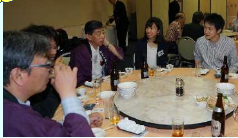
みんなで楽しく乾杯！