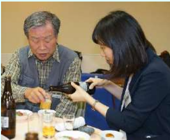
先輩 飲んでますか？