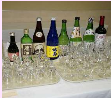
お酒の準備はいつも完璧です！