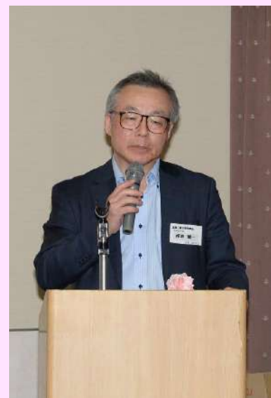
板倉理事長のご講話