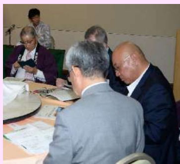
熱心に審議されました。①