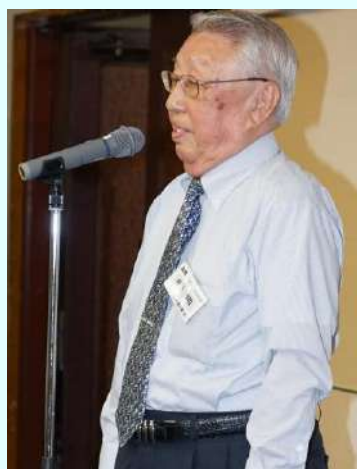
井下顧問のお話。深いです。