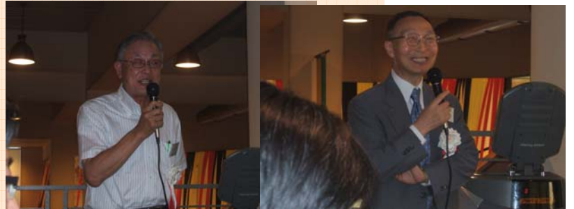
同窓会交流 東京EEC様