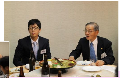
新人VIP 年の差知れず