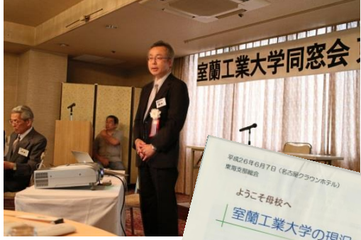
母校の現状 板倉同窓会本部理事長殿