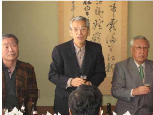
かんぱい あいさつ