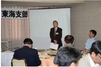
開会の辞 渡会副支部長