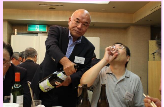
せっ先輩パワハラですそんなに のめ!