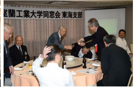
先輩・いやいや S31年卒です