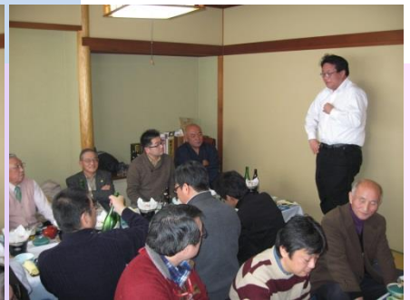
全員集合/こども元気にやりましょうー