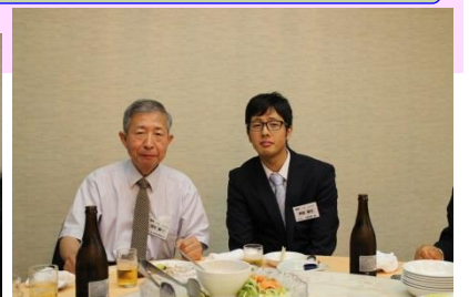
新人とは仲良くしとかなくちゃ