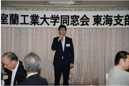
新人会員 なんとH26年卒だっ