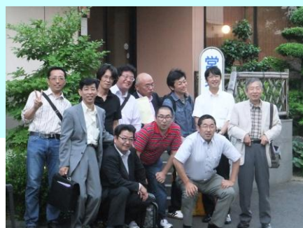
総会・懇親会出席者（敬称略失礼します）