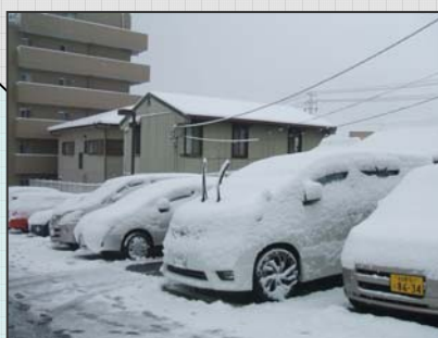
1 月 17 日大雪 内地でもこんなに積もりました