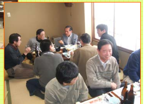
前出さんのエール 渋谷顧問の閉会挨拶