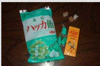
内地でも売っています 池田のバンビも