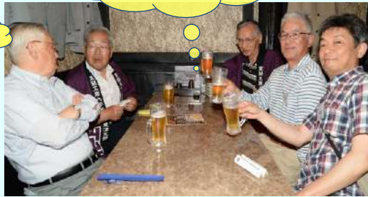
みんなで楽しく乾杯！