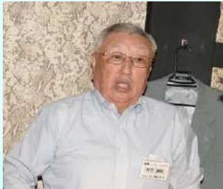
いつもいいお話し、井下顧問