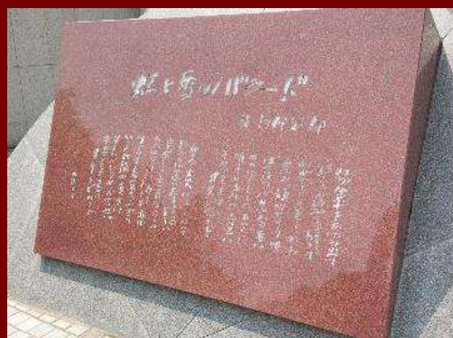
写真4 虹と雪のバラードの碑(2019年6月30日)

※2019年7月2日付で室蘭工業大学同窓会ホームページ掲載の「東海支部報 室工大東海支部有志5名きたる！」もぜひご覧ください。