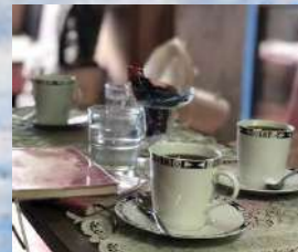
室蘭ランプ城にて