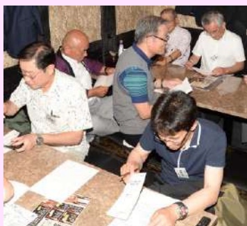
熱心に審議されました。②