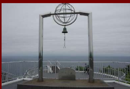
写真2 地球岬 幸福の鐘(2019年6月29日)