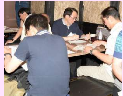
熱心に審議されました。①