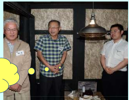
先輩！二次会はどこでやるんですか？