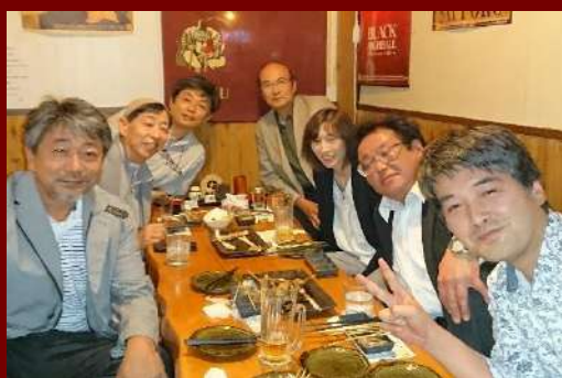
写真1 懇親会で記念撮影(2019年6月28日)

秋田支部より、東海支部のHPを見て、参考にさせていただき、今後、機会があれば、室蘭での交流会を考えていきたいとのことでご連絡をいただきました。ぜひよろしくお願ひします！青春の地、室蘭でお会いしましょう！