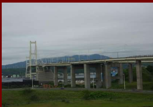
写真3 白鳥大橋(2019年6月29日)