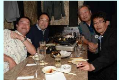
皆さん笑顔が素敵です。