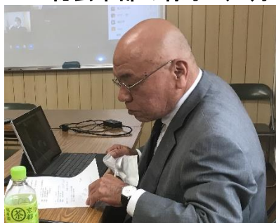
挨拶する角岡支部長