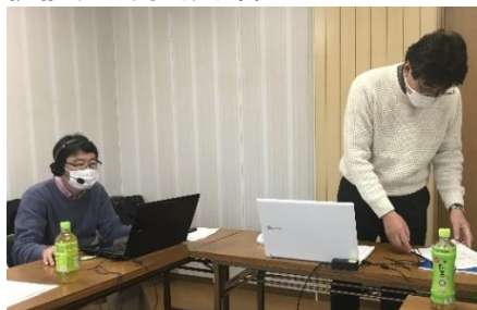
司会進行の新長澤事務局長(左)瓜生監査役(右)