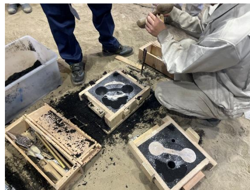
図 3 キュポラ操業実習 札幌工業高等学校