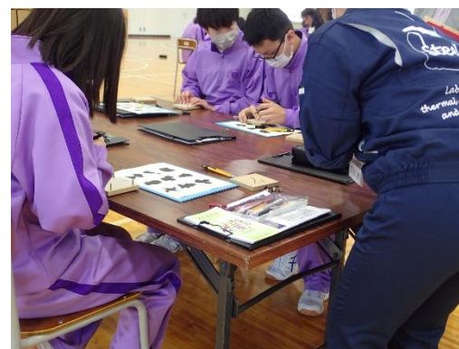
図 4 出前ものづくり教室 六ヶ所高等学校