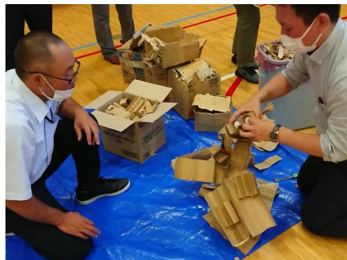
図 2 出前ものづくり体験教室 大樹小学校