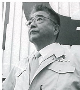
株式会社 エフ・イー 代表取締役社長

金沢工業大学 機械工学科 卒業。1991年 父親より(株)佐々木鉄工を引き継ぎ代表者 に。同年、(株)甲斐鉄工と統合、社名を(株)エ フ・イーとする。鉄工業から農業機械の製作・設 計へと業務を多角化し、2004年「葉付き大根洗 浄機の開発」において(社)発明協会 地方発明 表彰会長奨励賞を受賞。2010年北海道知事よ り「北海道チャレンジ企業 経営革新部門」に選 定される。 「ものづくりは『きづき』から始まる」とお客様の 声に常に耳を傾け、信頼を高めていくことを理念 としている。趣味はアウトドアと釣り、仕事。