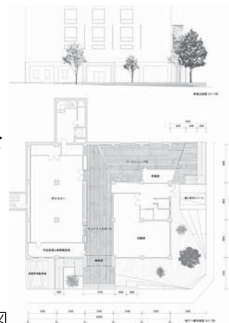
(実践例) 室蘭市民美術館 計画図

地域性などを「規模の小さい」「活発的でない」など消極的に捉えない。 地域性などの長所に目を 向けた建築のあり方を考 える。