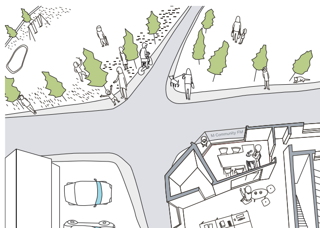
(実践例) 室蘭市コミュニティFM、提案図