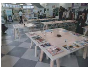
(実践例) 中島商店街コンソーシアム

建築計画という分野は人間や社会・地域を対象にデザインを考える分野である。デザイン行為によって新たな価値を生み出し、人間が住みよいまちづくりに貢献する。