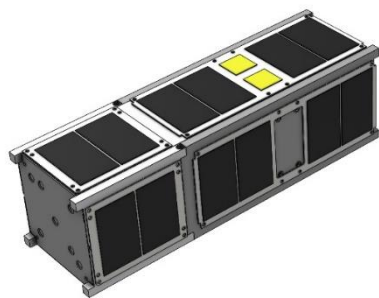
図1 超小型人工衛星「HOKUSHIN-1」 太陽電池パネル 展開前

http://unisec.jp/j-cube/2021_j-cube_result.pdf